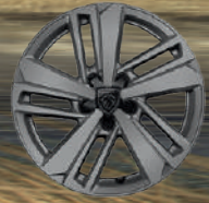
16" Alüminyum Alaşimli Jantlar AUCKLAND (2)