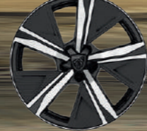
18" Alüminyum Alaşimli Jantlar KAMAKURA (5)