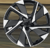
17" Alüminyum Alaşimli Jantlar HALONG (3)