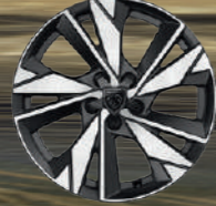
17" Alüminyum Alaşimli Jantlar CALGARY (3)