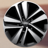
17" Jant Kapakları