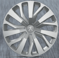
16" RAKIURA Çelik Jant (Kapaklı) RAKIURA