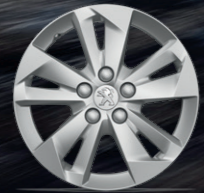
16" TARANAKI Alüminyum Alaşım Jant