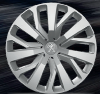
16" RAKIURA Jant Kapakları