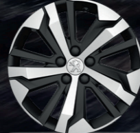
17" AORAKI Alüminyum Alaşım Jant