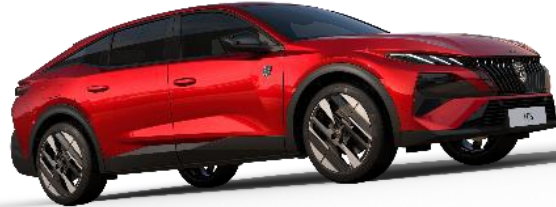
Elixir Kırmızı M5VH