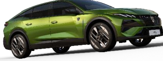
Aura Yeşil M0F9