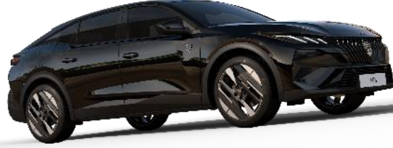
İnci Siyah M09V