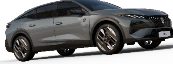
Selenyum Gri M0LD