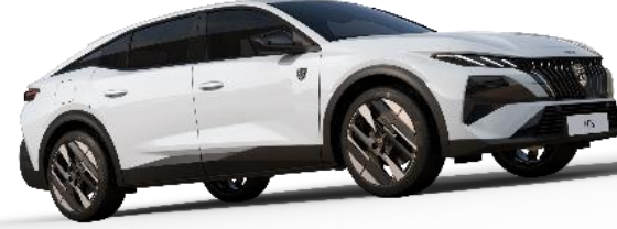
Okenit Beyaz M0SU