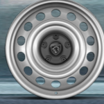
16" Jant Kapakları