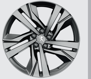
19" AUGUSTA elmas kesim, çift renk