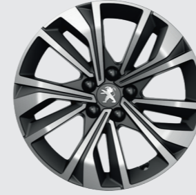
17" MERION elmas kesim, çift renk