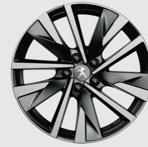
18" SPERONE elmas kesim, çift renk