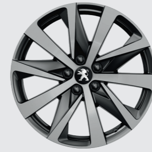
18" HIRONE elmas kesim, çift renk, toz gri renkte vernik kaplama